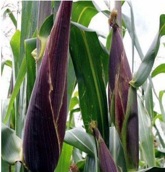
Ilustración 5 floración del maíz willkaparu