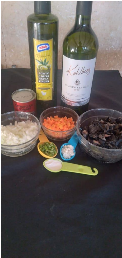
Ilustración 12 ingredientes para la salsa de gallo