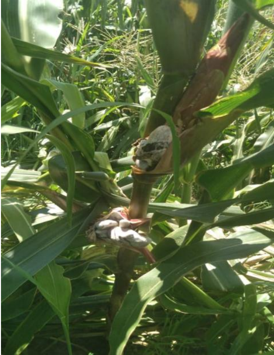
Ilustración 2 floración del maíz