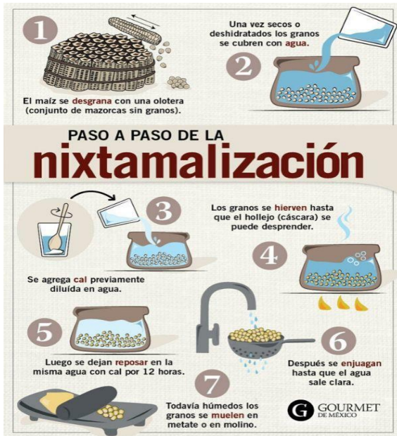
Ilustración 8 proceso de nixtamalización del willkaparu