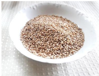
Figura Nº 13 Sésamo nacarado

1.- Nacarar el sesamo, llevar a ebullicion el moco chinche