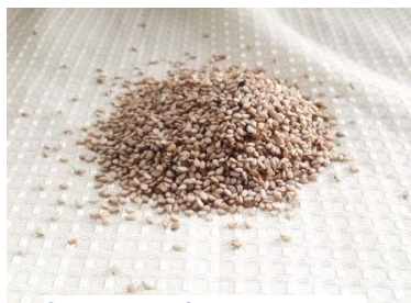
figura Nº 6 sésamo