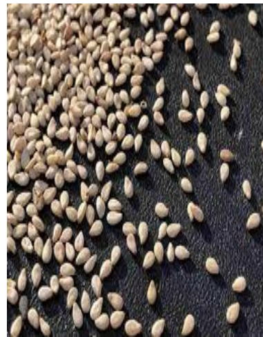
Figura N° 3 secado de sésamo