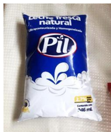
Figura Nº 9 leche