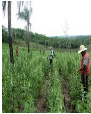
Figura N° 2 planta de sésamo

El deshidratado de durazno y secado del sésamo.