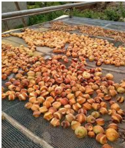
Figura N° 4 deshidratado de durazno

El deshidratado de durazno y secado del sésamo.