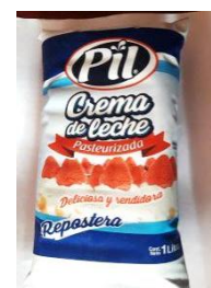
Figura Nº 12 crema de leche