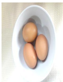
Figura Nº 8 huevo