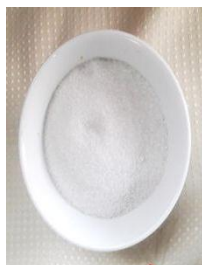
Figura Nº 10 azúcar