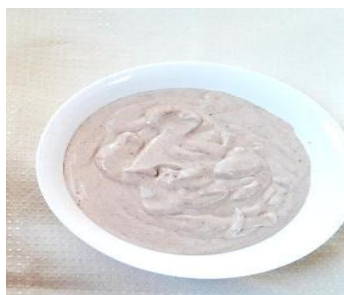
Figura Nº 16 moco chinche procesado con leche

3.- Procesar el sésamo y moco chinche con leche.