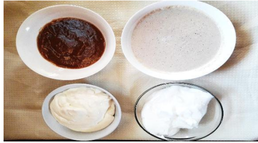
figura Nº 18 mezclar los ingredientes

4.- Montar la crema y con las claras hacer un merengue suizo a baño maría