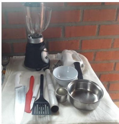
Figura Nº 5 utensilios