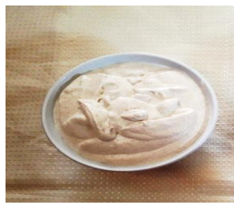
Figura Nº 17 sésamo procesado con leche