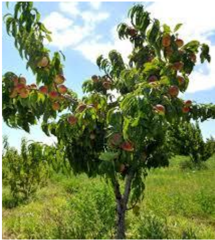
Figura N° 1 planta de durazno

Descripción de la planta de moco chinche y sésamo.