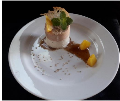
Figura Nº 19 producto final decorado con obleas, hoja menta, durazno caramelizado, coulis de tamarindo