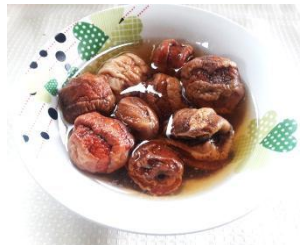
Figura Nº 14 moco chinche cocido

2.-Heshuesar el moco chinche y separa las claras del huevo