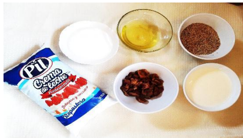
Figura Nº 15 Mise place

2.-Heshuesar el moco chinche y separa las claras del huevo