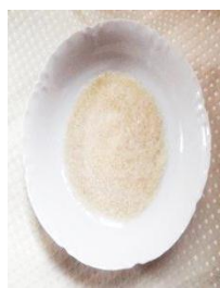
Figura Nº 11 gelatina sin sabor