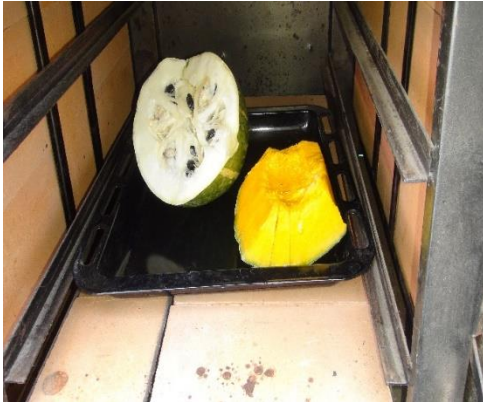
Figura 19. Llevar el zapallo y lacayote al horno previamente lavados por aproximadamente una hora.