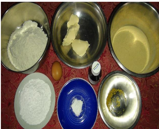
Figura 10. Ingredientes