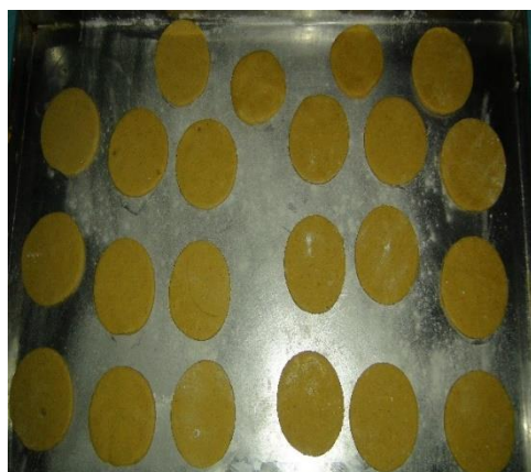
Figura 17. Cortar las tapas con un cortador circular, y llevar al horno en una placa previamente encamisada.