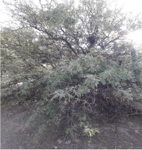
Figura 1. Planta algarrobo.