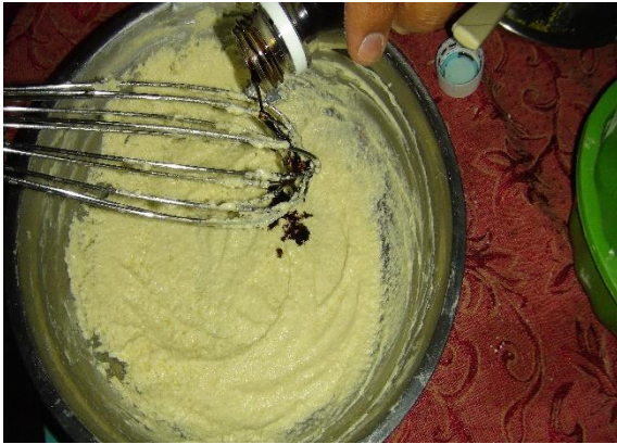
Figura 12. Incorporar esencia de vainilla.