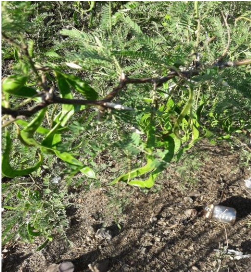
Figura 3. Frutos verdes del algarrobo