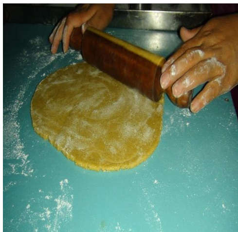
Figura 16. Estirar la masa