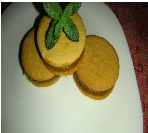
Figura 26. “alfajores con harina de algarroba rellenos de manjar de zapallo y lacayote”