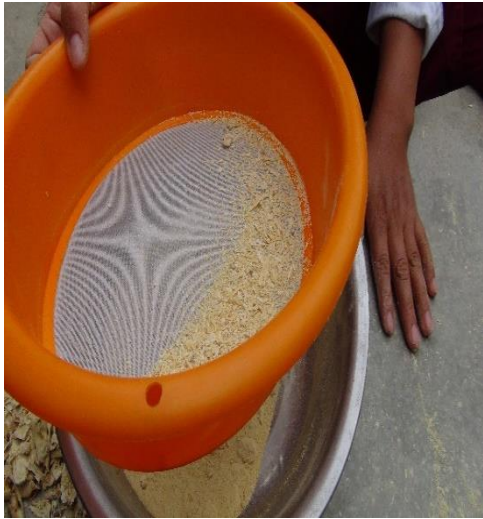
Figura 8. Tamizado para eliminar todas las impurezas.