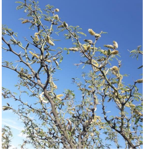
Figura 2. Flores de la planta de algarrobo