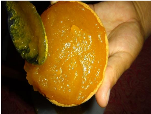
Figura 24. Rellenar las tapas