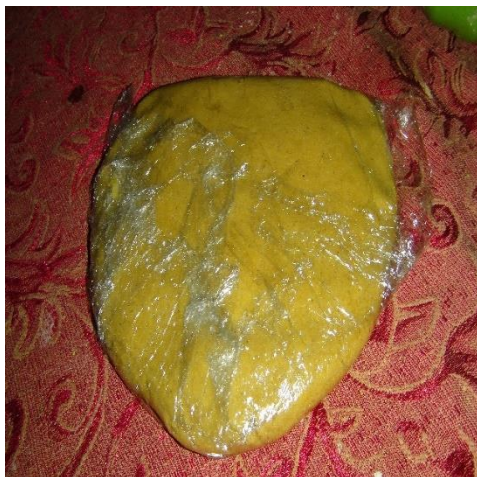
Figura 15. Formar una masa y llevar a la nevera en papel film.