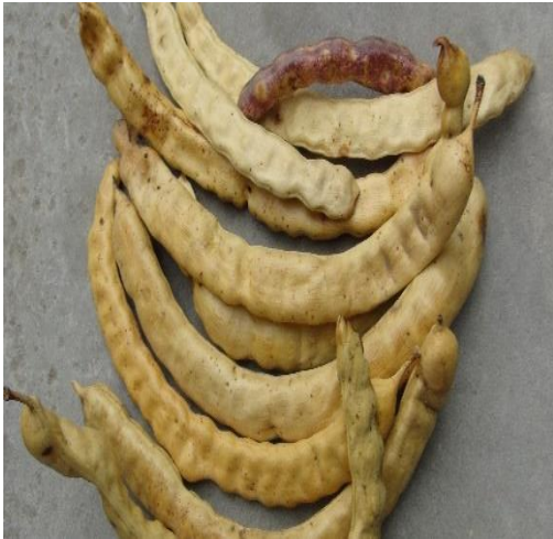
Figura 5. Frutos maduros y secos del algarrobo.