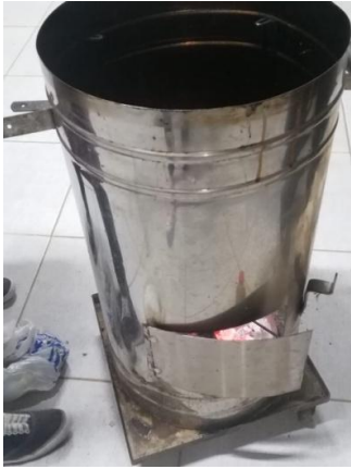
Fig. 7 Cilindro ahumador. del chorizo