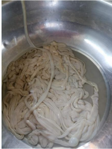
Fig.1 Tripa de cordero