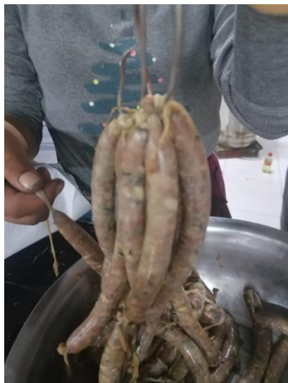
Fig.5 Chorizo en ganchos de cilindro ahumador