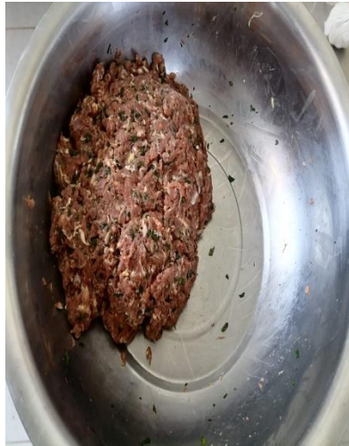
Fig.2 Carne de cordero molida y condimentada