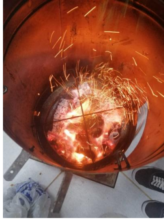
Fig. 8e incorporación de romero para ahumar