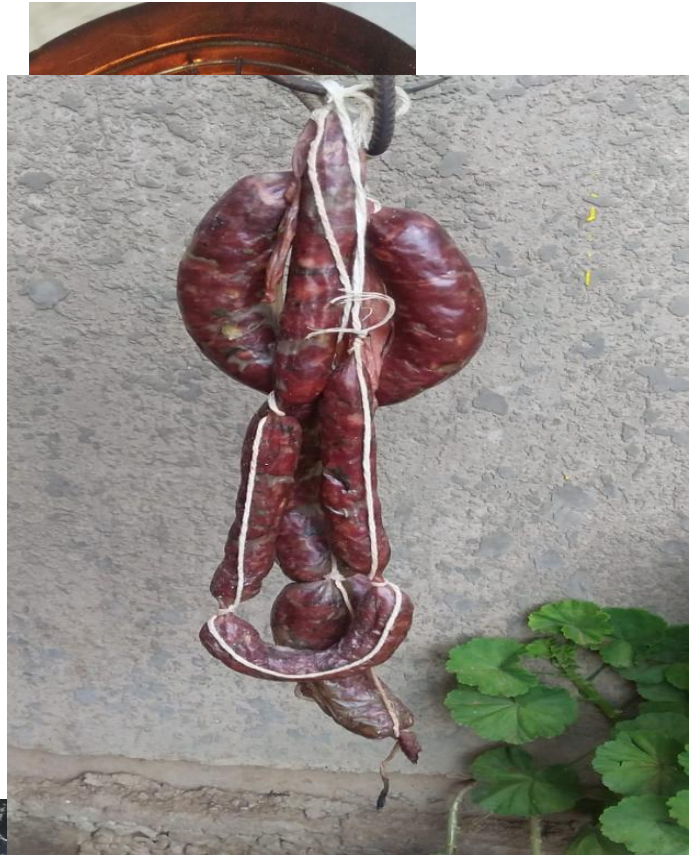
Fig.12 Producto final: "Chorizo de cordero ahumado"