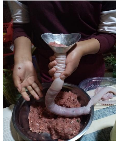
FIGURA 6 EMBUTIDO DE CHORIZO