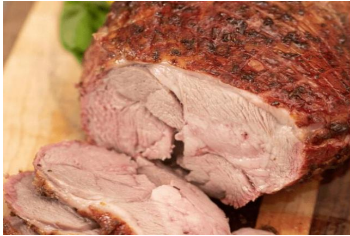
FIG.1 CARNE AHUMADA DE CORDERO