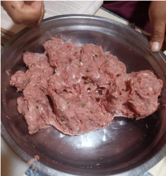
FIGURA 5 MEZCLAR PARA EL EMBUTIDO