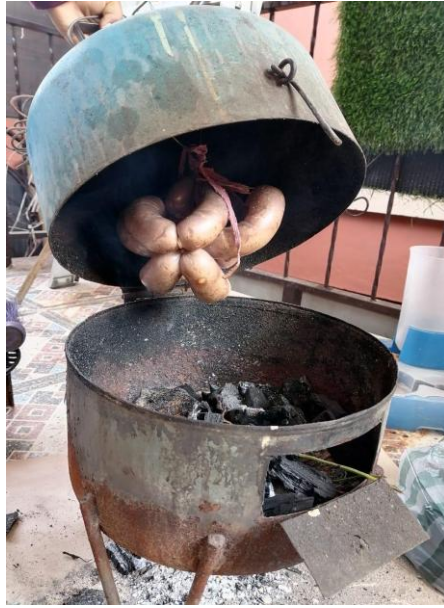
PRODUCTO FINAL CHORIZO AHUMADO