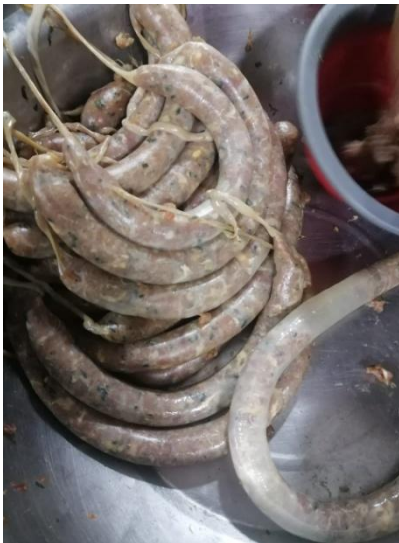
Fig.4 producto: chorizo.