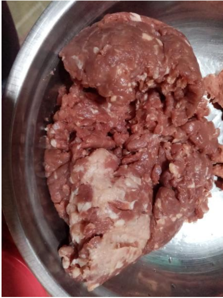
FIGURA 1 : CARNE MOLIDA DE CORDERO