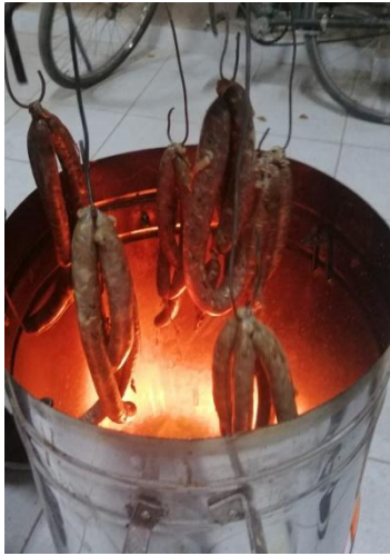
Fig.10 Ahumando el chorizo