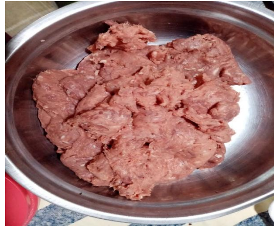
FIGURA 2 : CARNE MOLIDA Y PROCESADA DE CORDERO