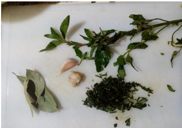
FIGURA 3 :CONDIMENTOS ESPECIES