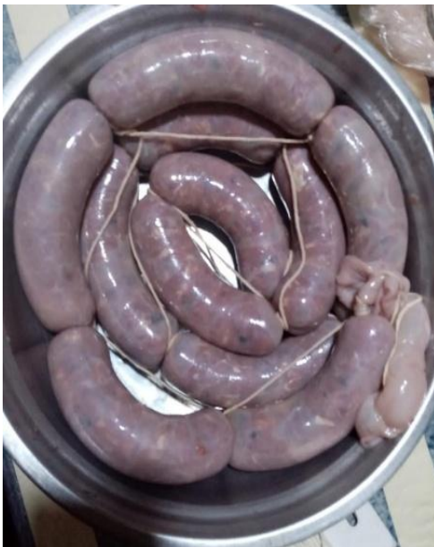
FIGURA 7 PRODUCTO FINAL CHORIZO