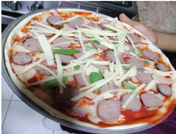
FIGURA 10 CHORIZO AHUMADO APLICANDO EN PIZZA