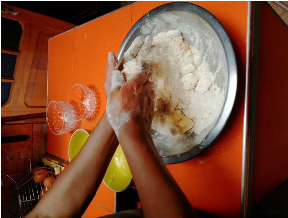
APLICAMOS LA TÉCNICA DEL ARENADO