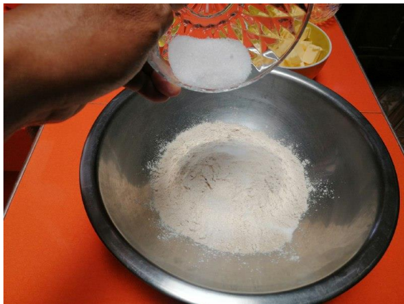
AÑADIMOS EL AZUCAR