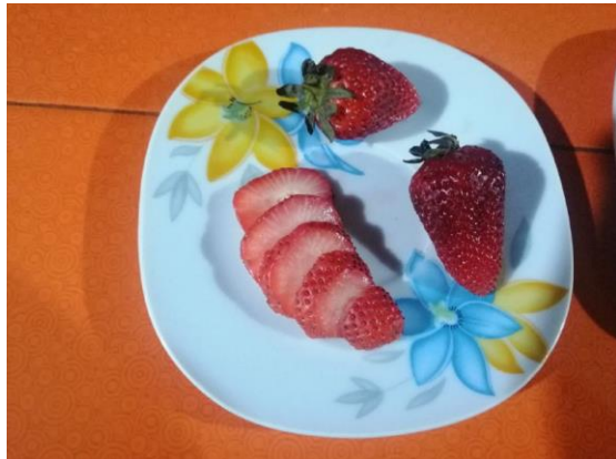
FRUTOS ROJOS DE TEMPORADA