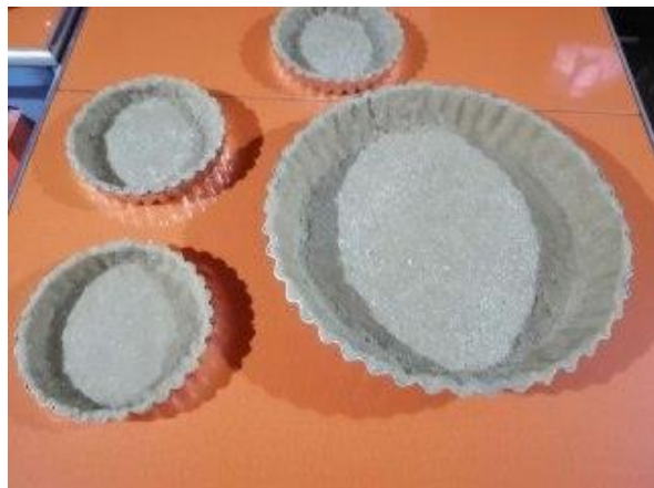
COLOCAMOS EN EL MOLDE