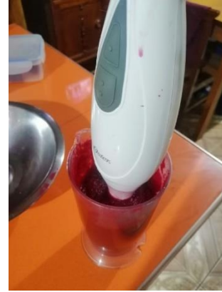
PROCESAMOS CON EL MIXER