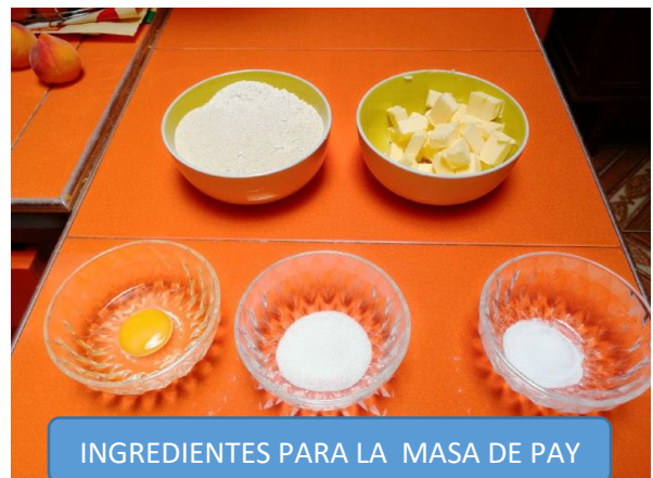
INGREDIENTES PARA LA MASA DE PAY