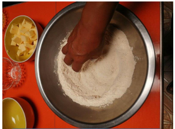
MEZCLAMOS LOS INGREDIENTES