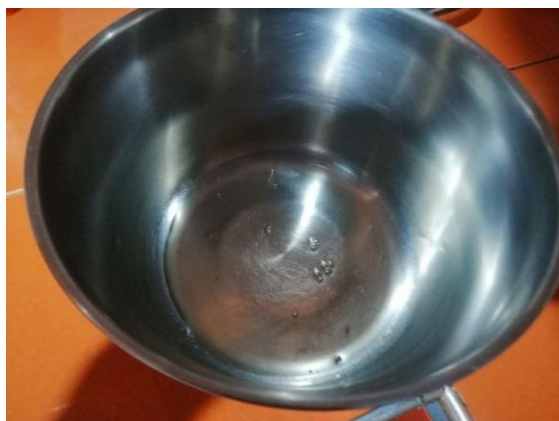
CLARA DE HUEVO