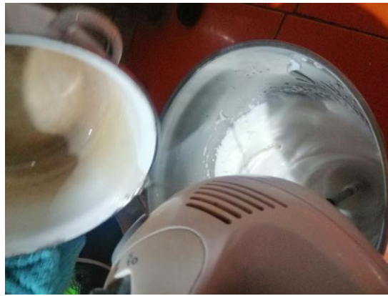
CUANDO EL AZUCAR ESTE EN SU PUNTO ECHAMOS A LAS CLARAS BATIDAS A PUNTO