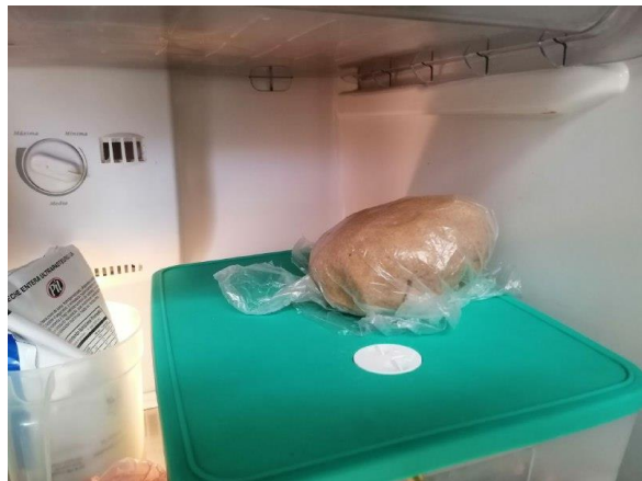
LLEVAMOS A REFRIGERAR