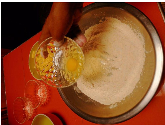
INCORPORAMOS EL HUEVO