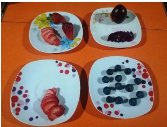
SEPARAMOS LOS FRUTOS