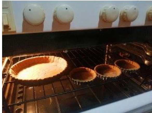
LLEVAMOS AL HORNO A 180 °C