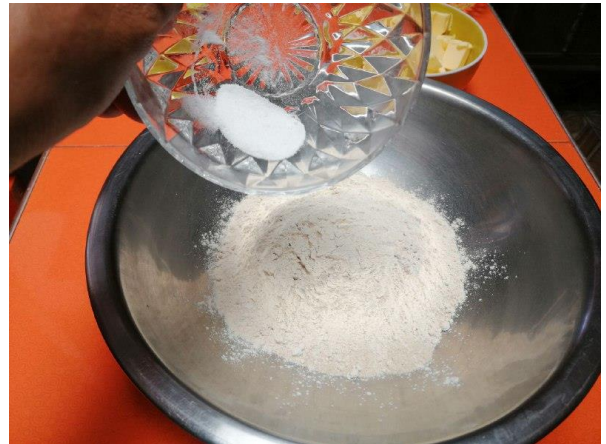
AÑADIMOS LA SAL