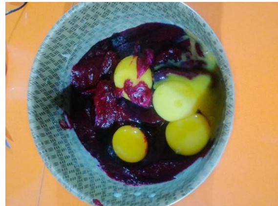
AÑADIMOS LAS YEMAS DE HUEVO