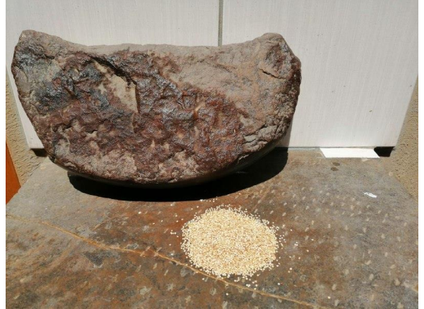
MOLIDO DE LA QUINOA