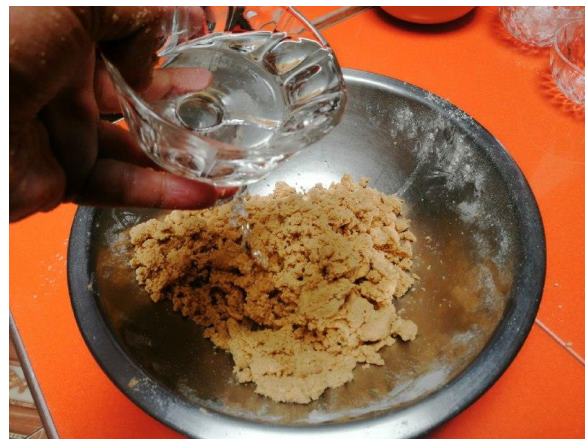
AÑADIMOS AGUA SEGÚN LO