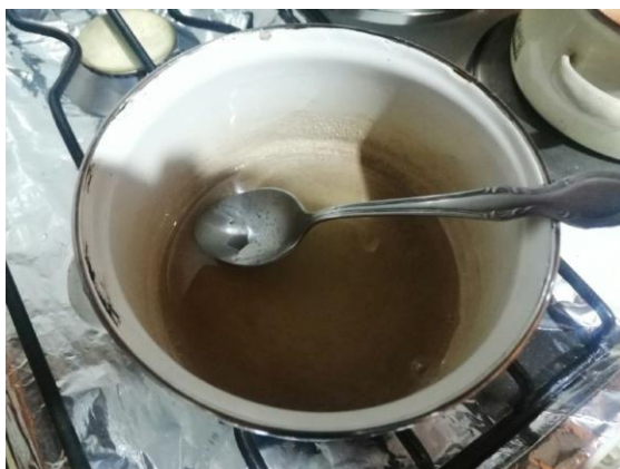
OLLA CON AZUCAR Y AGUA (HEBRA FUERTE)