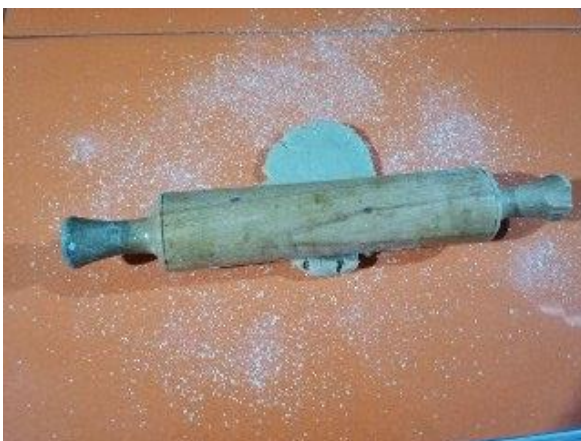
CON EL RODILLO DAMOS FORMA