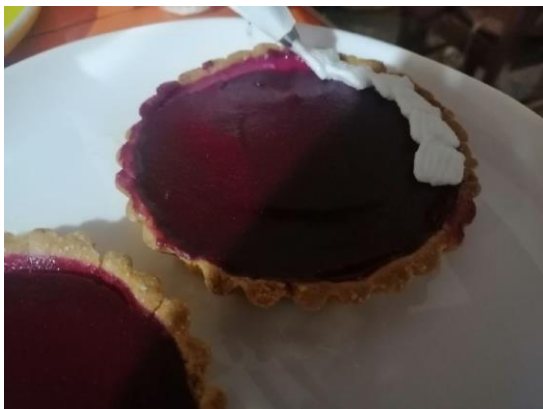
Figura N° 8 (DECORADO)