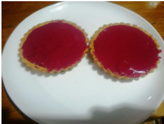
Figura N° 5 (RELLENAMOS EL PAY: CREMA INGLESA)