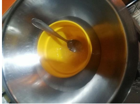
HIDRATAMOS GELATINA SIN SABOR