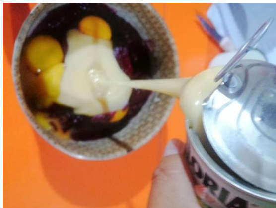
INCORPORAMOS LECHE CONDENSADA