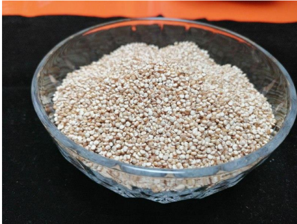
QUINOA LAVADA Y LIMPIA