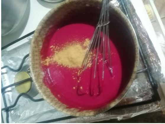
COLOCAMOS CANELA MOLIDA