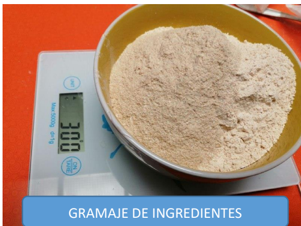
GRAMAJE DE INGREDIENTES