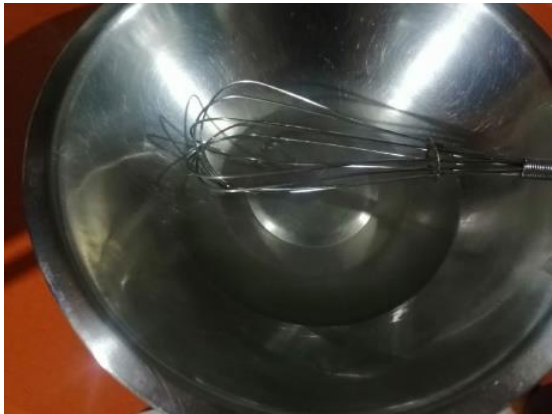
HIDRATANDO LA GELATINA SIN SABOR