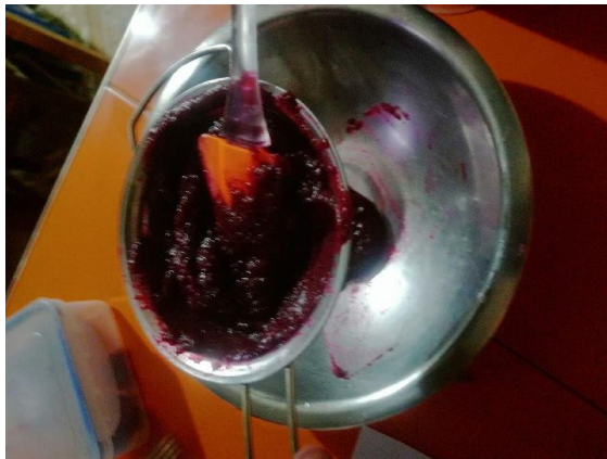
PASAMOS POR UN COLADOR