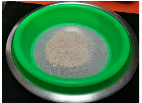
PASAMOS POR UN TAMIZADOR