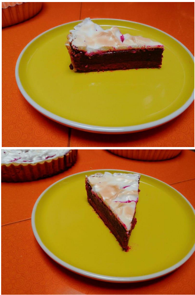
PORCIÓN DE PAY DE BETABEL