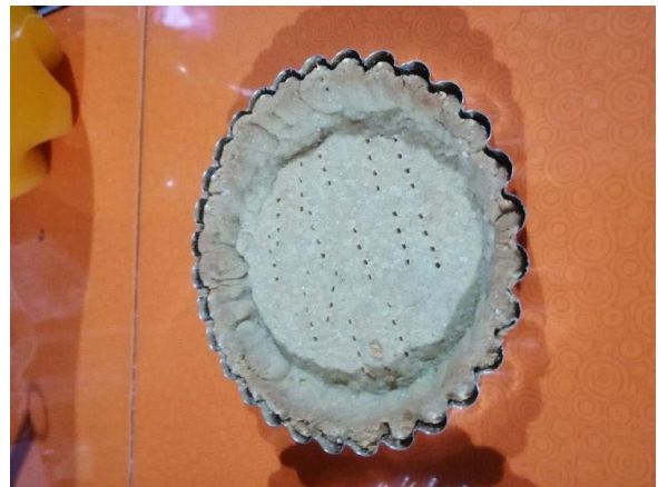
COCIDO EL PAY