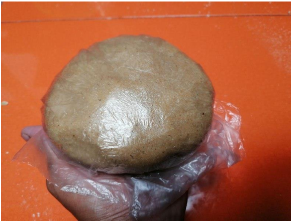
ENVOLVEMOS EN FILM LA MASA