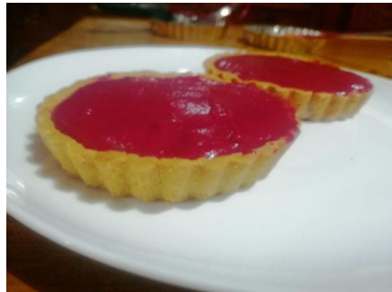
IMPERMEABILIZAR EL PAY COLOCAMOS EL GANACHE Y RELLENADO CON LA REMOLACHA