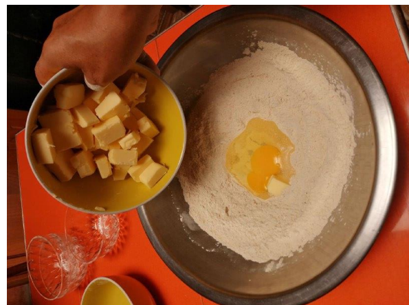
AÑADIMOS LA MANTEQUILLA FRIA