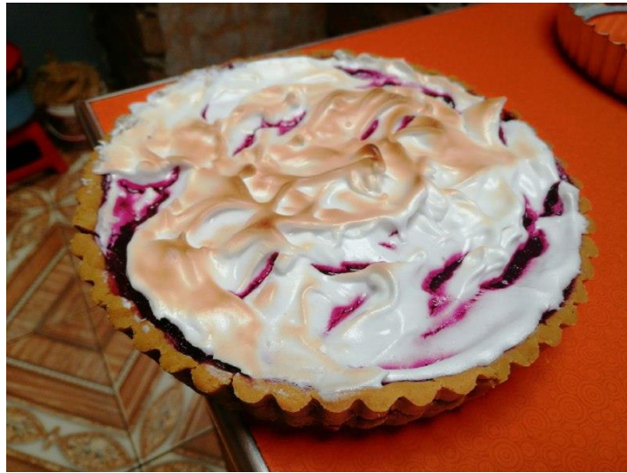
DECORADO CON MERENGUE ITALIANO