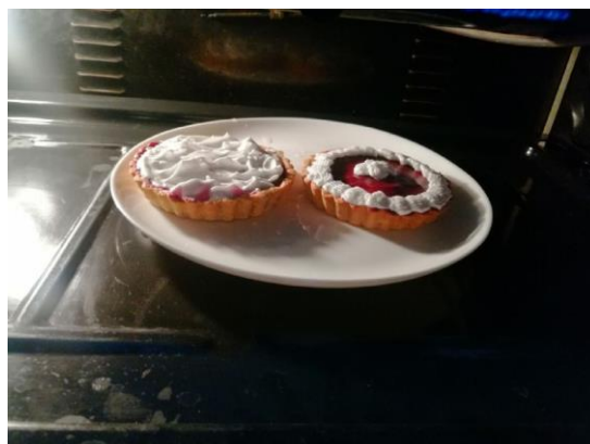
DECORADO CON MERENGUE ITALIANO