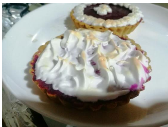
EN EL HORNO PARA QUE TOME COLOR EL MERENGUE