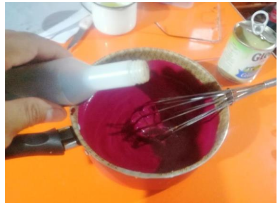
AÑADIMOS ESENCIA DE VAINILLA