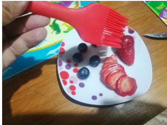
CON LA BROCHA DAMOS BRILLO