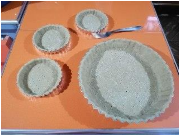
CON TENEDOR HACEMOS HUECOS