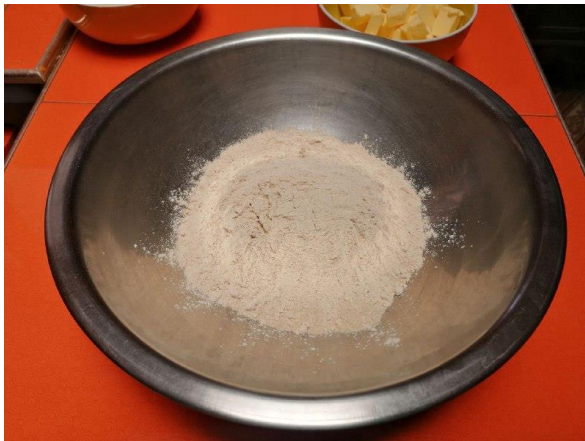
EN UN BOL COLOCAMOS LA HARINA