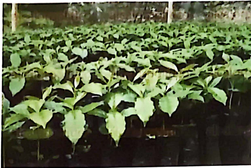
Plantines de café castilla listo para tranplante