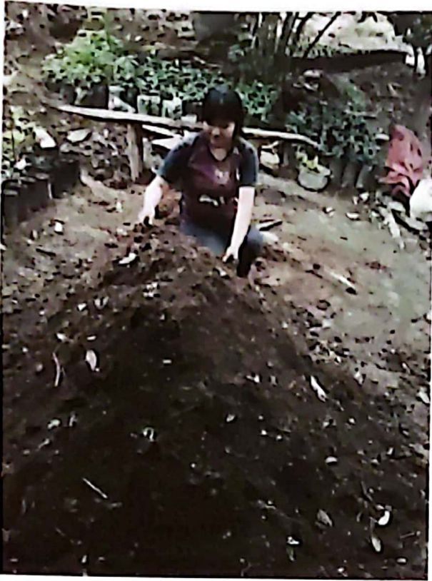
Preparando el abono