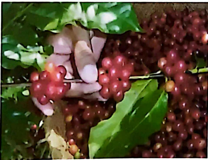
Selección de semilla de café